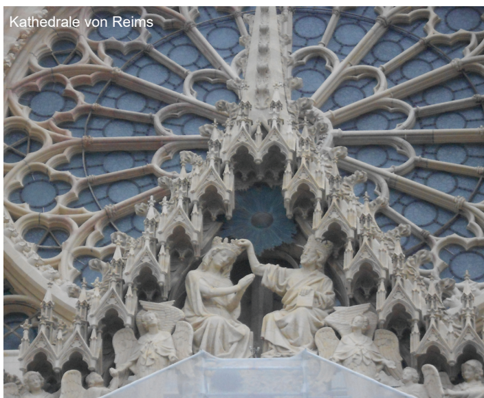
Kathedrale von Reims